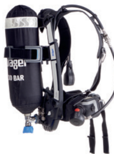
Atemwiderstände → Atemarbeit → Belastung für den Menschen