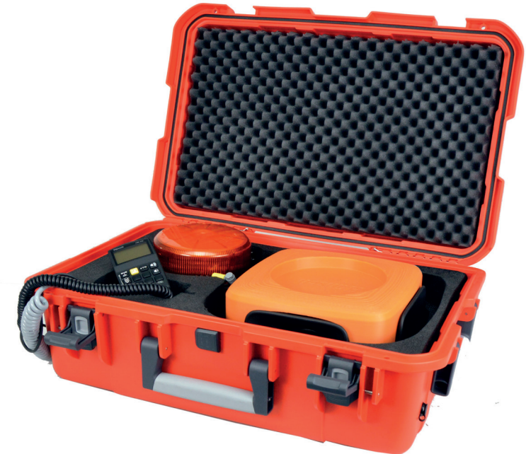
Transport-Koffer mit Komponenten